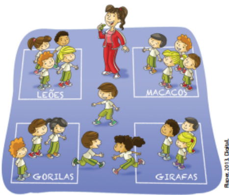
Jogo troca de papéis