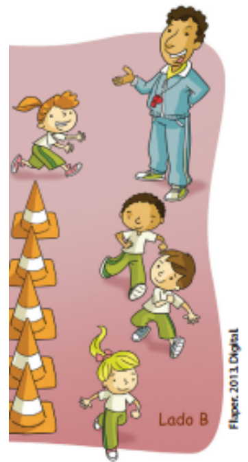
Jogos de perseguir