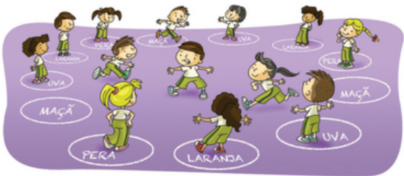
Jogo de troca de lugar