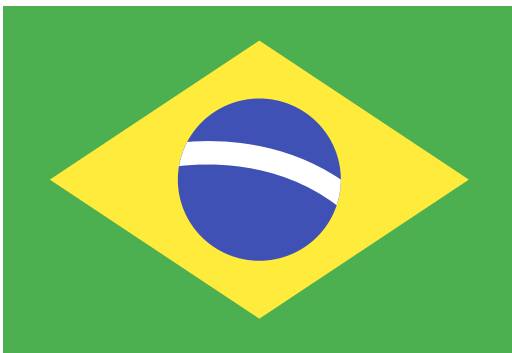
MARAJÓARA e HUKA HUKA (BRASIL)