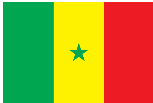
À LAAMB (SENEGAL)